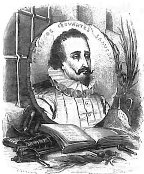
Dibujo de David y grabado de G. Staäl, Miguel de Cervantes , 1887.

El dominio del espíritu se impone así y esta interpretación de Unamuno pretende abarcar la profundidad del símbolo en donde hay un hombre —don Quijote— que con palabras sublimes llega hasta lo más profundo del humilde corazón de los cabreros.